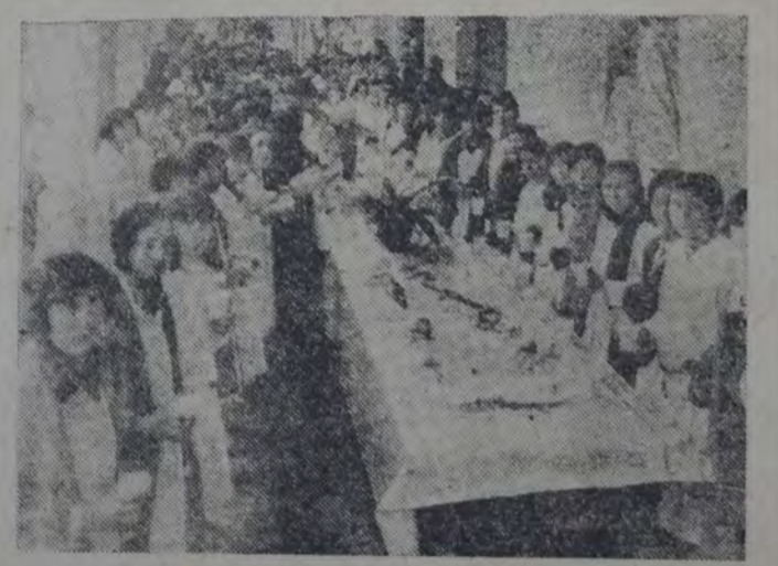
EN LA ESCUELA Nº 1 DE LA CIUDAD DE PERGAMINO (BUENOS AIRES). Una vista del día en que se sirvió por primera vez la "Copa de leche" a los alumnos de ese establecimiento.

torizando al P. E. a invertir hasta la suma de 140.000 pesos para la construcción de dos pabellones en el hospital Ayacucho, y el del señor Vignart, sobre el ejercicio de la procuración.