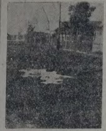
DE LA CALLE GUIDO, A SEIS CUADRAS DE LA ESTACIÓN.